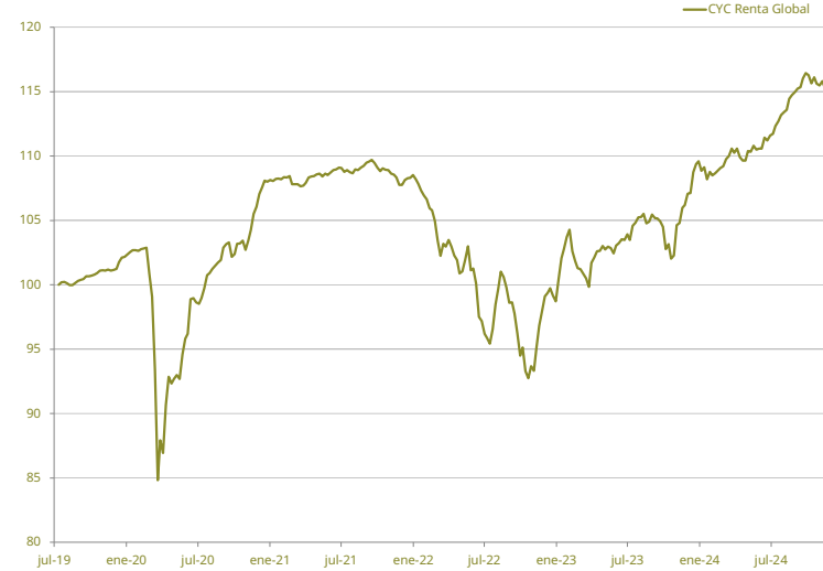
EVOLUCIÓN DE NAV DESDE INICIO