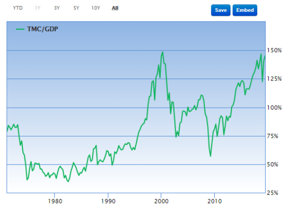
The Ratio of Total Market Cap to US GDP